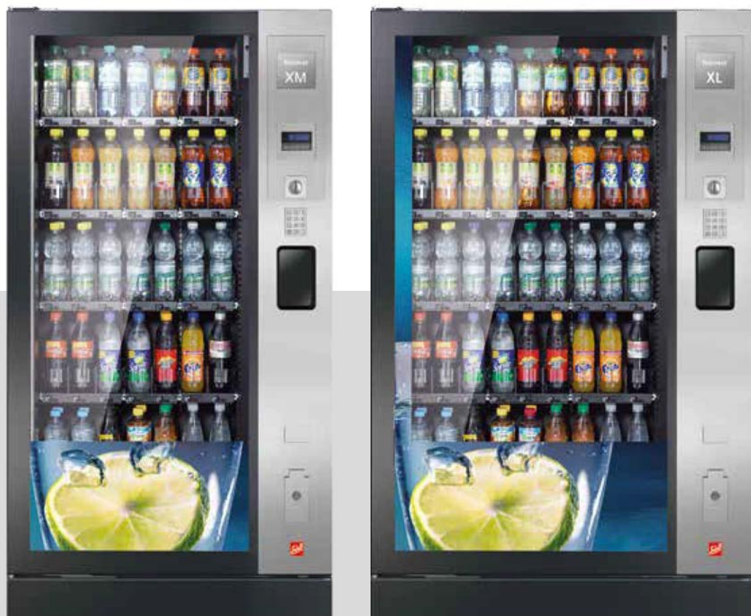
Robimat XM et XL avec cache en inox.