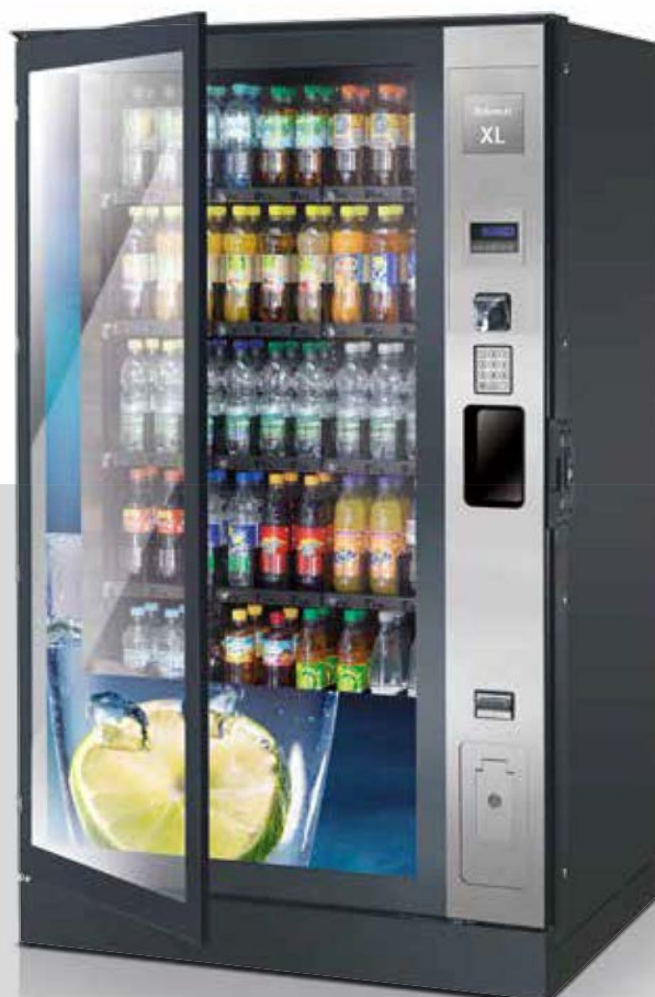
Illustration : Robimat XL en version Haute sécurité