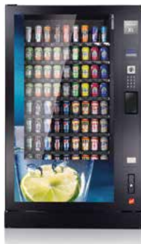
Robimat XL, configuration classique avec 8 plateaux