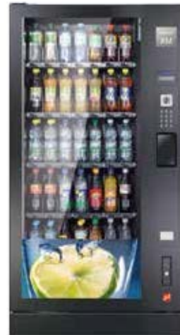
Robimat XM, configuration classique avec 5 plateaux