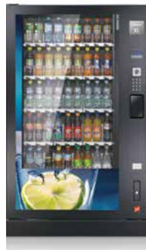
Robimat XL, configuration classique avec 5 plateaux