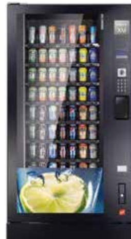
Robimat XM, configuration classique avec 8 plateaux